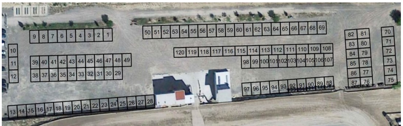
Plano distribución Boxes